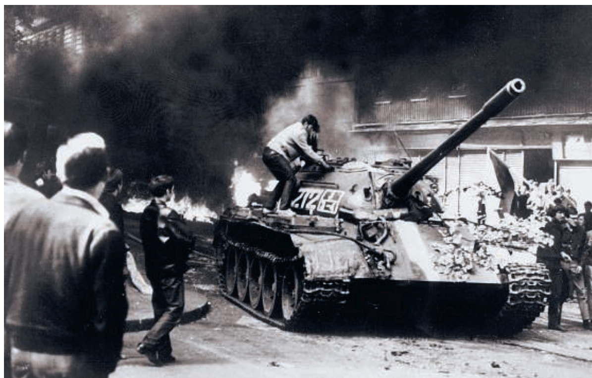
Invasione Il mondo assistette con il fiato sospeso alla marcia su Praga delle truppe del patto di Varsavia.

Stato numero 1 a Yalta, nella penisola di Crimea, assillandolo però un dilemma: mandare carri armati e soldati in Cecoslovacchia, perché i «compagni» non si comportavano a dovere, oppure lasciare loro aperta una «chance». Il Partito Comunista a Praga aveva proclamato «il socialismo democratico» in primavera, concedendo diritti ai cittadini sia attraverso una parziale decentralizzazione dell'economia, sia allentando le restrizioni sui media, i viaggi e la libertà di parola. Alexander Dubcek, salito al potere in gennaio, federalizzava inoltre il Paese in due nazioni. Era una politica fatta per inviperire gli uomini al potere nelle altre nazioni del Patto di Varsavia. I duri del Cremlino spingevano per un colpo militare contro i riformisti rinnegati. Avevano guardato con favore a Dubcek (che in gioventù era vissuto per dodici anni in Unione Sovietica) allorché aveva sostituito lo stalinista Antonin Novotny alla guida del Partito. Ma in marzo il Comitato centrale del Pcus metteva in guardia il resto del blocco comunista